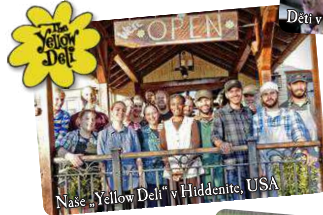
Naše „Yellow Deli“ v Hiddenite, USA

kde se jim můžeme z celého srdce věnovat. Některá naše společenství jsou ve městech, kde pracujeme v našich restauracích „Yellow Deli“, a jiná jsou na farmách,