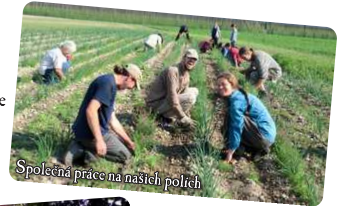
Společná práce na našich polích

kde pracujeme na polích nebo se staráme o zvířata. Každé ráno a večer se společně scházíme, abychom děkovali a chválili našeho Stvořitele.