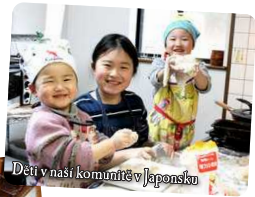
Děti v naší komunitě v Japonsku

spolu jako jedna velká rodina - svobodní lidé, rodiny s dětmi, staří i mladí. Milujeme a vážíme si svých dětí. Jsou nedílnou součástí našeho života. Učíme je doma,