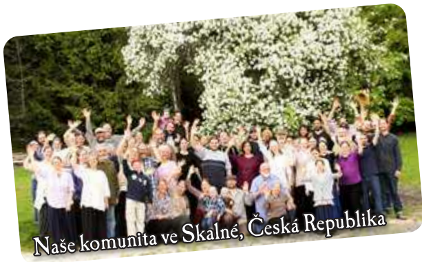
Naše komunita ve Skalné, Česká Republika