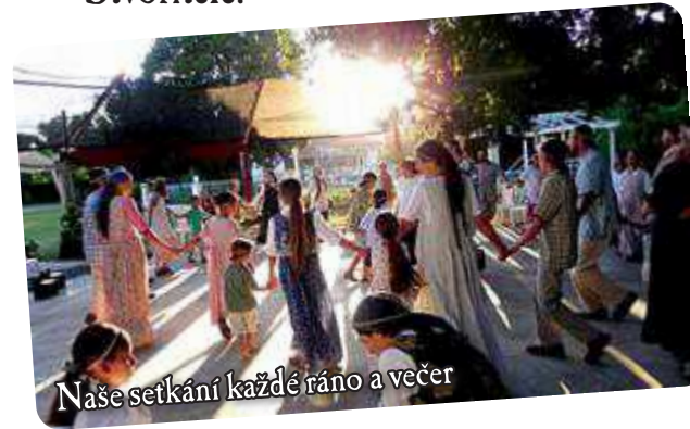
Naše setkání každé ráno a večer

Pokud se tato pozvánka dotkla vašeho srdce, přijďte se za námi podívat!