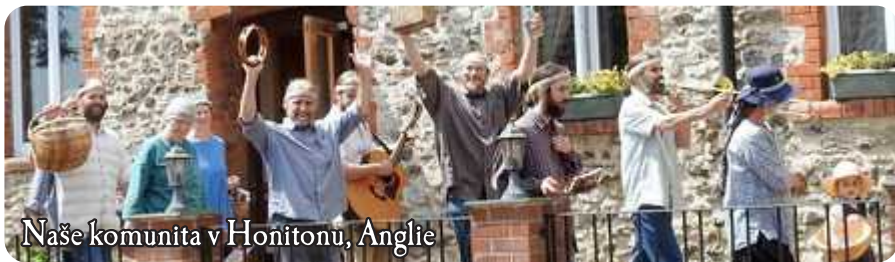
Naše komunita v Honitonu, Anglie

Náš život v komunitách Dvanácti kmenů je plodem naší upřímné odpovědi na Jašuovu lásku a jeho poselství. Žijeme