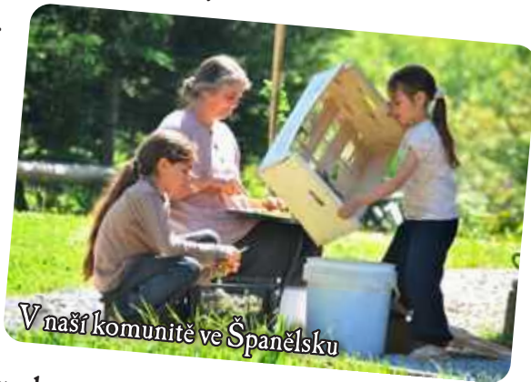
V naší komunitě ve Španělsku

Byli jsme ti, kteří z hloubi srdce toužili najít něco, co by stálo za to, abychom se tomu odevzdali. Bez ohledu na to, jaké bylo naše povolání nebo odkud jsme přišli, nedokázali jsme umlčet touhu, kterou jsme cítili ve svých srdcích, touhu po hlubším smyslu života. Chtěli jsme utéct od hledání sebe sama, o kterém jsme věděli, že nás nemůže naplnit. Ještě víc než to jsme chtěli najít způsob, jak se osvobodit od viny a utrpení, které jsme cítili sami v sobě a jehož jsme byli svědky všude kolem nás.